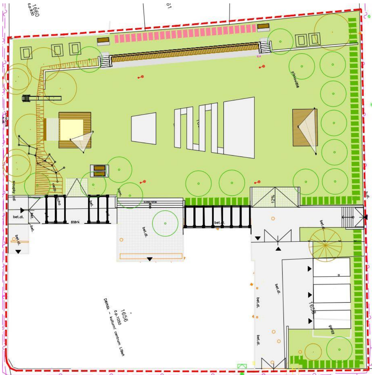
Obrázek 1: Ze studie revitalizace hřiště u Dělnáku

Na Dělnáku měla být v dubnu zahájena revitalizace zahrady. Z pandemických důvodů došlo k zpoždění zpracování projektové dokumentace a realizace začala až koncem listopadu 2020. Revitalizace byla zahájena bouracími pracemi, následně bude vystavěno nové oplocení pozemku, funkční prvky volnočasového a kulturního využití (podium, lavičky, pergola), sklad rekvizit a vysazena nová zeleň. Celý prostor bude bezbariérový a přístupný novou vstupní branou z ulice Klajdovské.